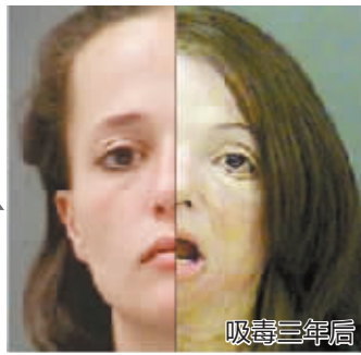
千万不要变成这样