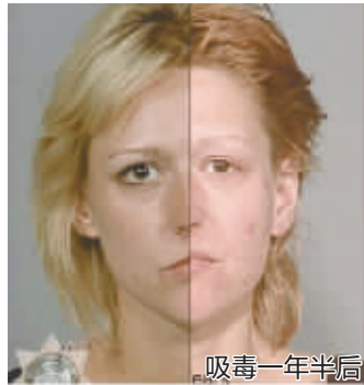
美国俄勒冈州一警察署搜集到的吸毒者前后对比照，很直观，有没有吓到你？