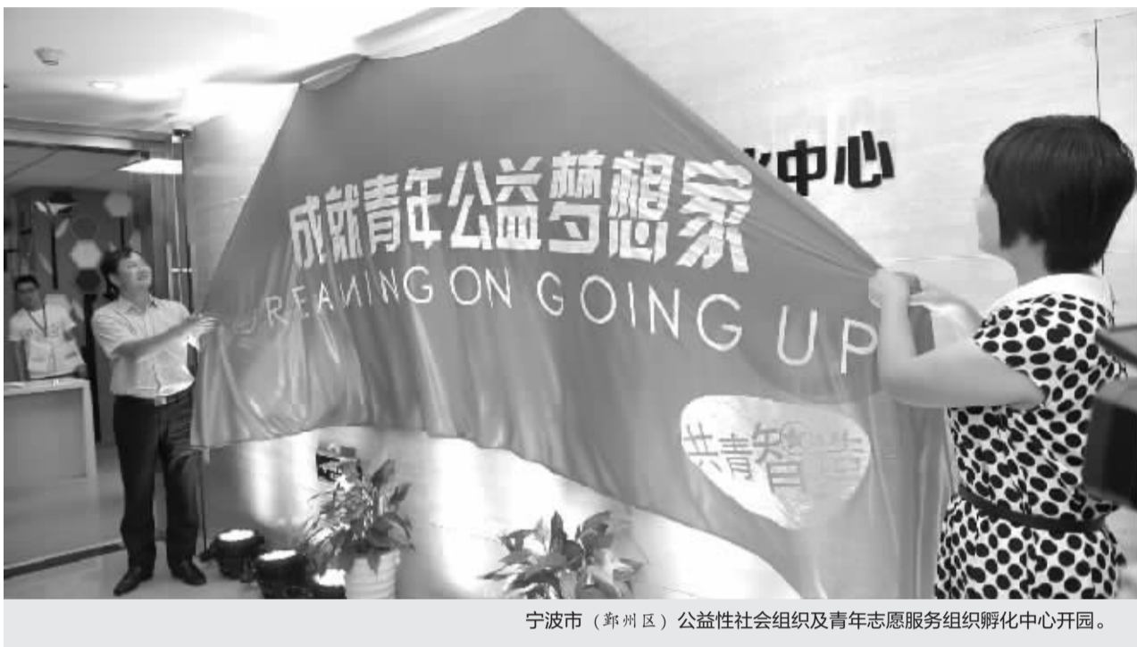
宁波市（鄞州区）公益性社会组织及青年志愿服务组织孵化中心开园。