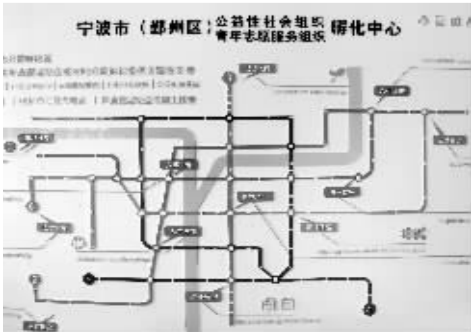
孵化中心流程示意图

“八方有爱”宁波市青年社会组织公益梦想金在孵化中心设立，宁波八方集团首期注资100万元主要用于孵化青年社会组织以及开展创投大赛、公益沙龙等相关活动。