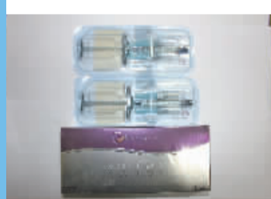
查获的假玻尿酸产品