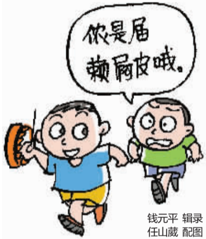
钱元平 辑录 任山威 配图