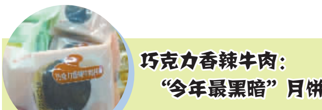
巧克力香辣牛肉： “今年最黑暗”月饼

临近中秋，一年一度的“月饼武林大会”再次上演，各路网友纷纷晒出形形色色的奇葩馅料月饼，例如巧克力香辣牛肉、韭菜鸡蛋、腐乳、奶酥松露鹅肝等口味的月饼。面对这些逆天搭配的月饼，小D只想问一句：“五仁君，你是否安好？”