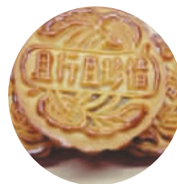
金句月饼： 史上最与时俱进月饼