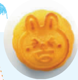
卡通月饼： 史上最萌月饼

一口吃掉可妮兔？这款卡通主题月饼，从包装到内容，简直可可爱到没朋友！不仅月饼上印着可妮兔和布朗熊，连包装的迷你尼龙抽绳袋、装月饼的小铁盒上，也都印有这款可爱爆棚的图样。至于味道，淡淡的奶甜味搭配薄薄的饼皮，一口吞一个的大小也是萌萌哒。