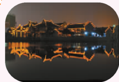
三江夜游：江上生明月 适宜对象：家人 推荐指数：★★★★

到江边走走，实在是个不错的主意，伴随着缓缓前进的游船，看着天上水上各有一个月亮的美景，那又是如何一番滋味呢？三江夜游是宁波的特色名片，在舒适的游船上，看空中月与水中月交辉，璀璨灯景与涟漪珠水争娆，真