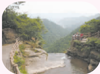
上林湖：水月交辉，人间仙境 适宜对象：情侣 推荐指数：★★★★

上林湖依偎于群山怀抱中，湖岸曲折多姿，湖面碧波荡漾，月圆之夜，水月交相辉映，风景更显绝美迷人。湖南面有座栲栳山，又名仙居山，相传曾有仙人居住。山中极其幽静，丰水时节，瀑布飞泻，犹如白练腾舞，