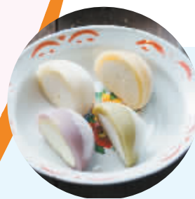
榴莲月饼： 史上最“异族”月饼

随着奇葩月饼大战的愈演愈烈，一些甜品店也不甘示弱，纷纷打算在这场战争中占领自己的一片江山，继榴莲威化、榴莲披萨之后，榴莲月饼也终于诞生。不过看着这清新的外表，你确定，这真的不是甜品家派来的间谍吗？