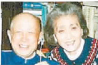
钱学森与爱人蒋英