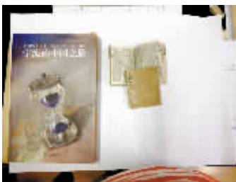
宁海籍著名收藏家储建国捐赠的《四书典仓》。