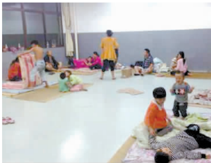
昨晚的象山县第五小学避灾点。该避灾点可安置300余名群众。