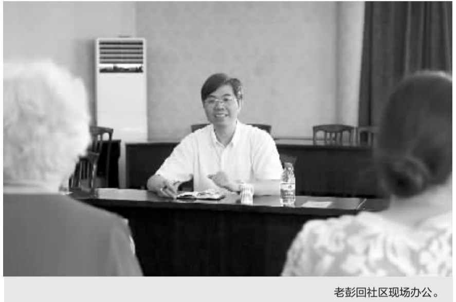
老彭回社区现场办公。

海曙区西门街道从前年年底开始，相继开展二十多次整治及清理行动，劝退无证设摊、破墙开店、开门占道等违法现象3000多起。到去年