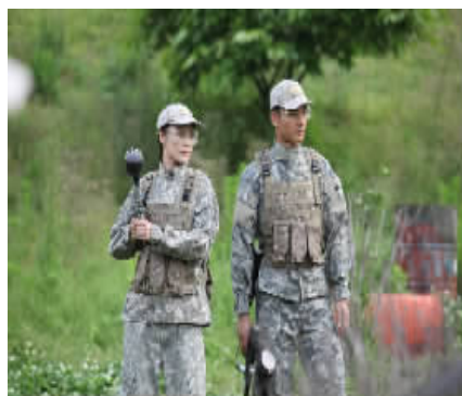
宁波首家 CS 彩弹野战游戏基地