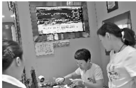
一家商场内,电子屏幕上显示金价的实时走势。

另外有分析人士指出,任何一个过热的市场回归理性是必然,而金价回归过程中有反弹属正常现象,但并不会改变其回归理性的大趋势。目前欧美等发达国家的央行仍有计划抛售黄金,只有中国、印度、俄罗斯等部分发展中国家将增持黄金,黄金价格仍不容乐观。