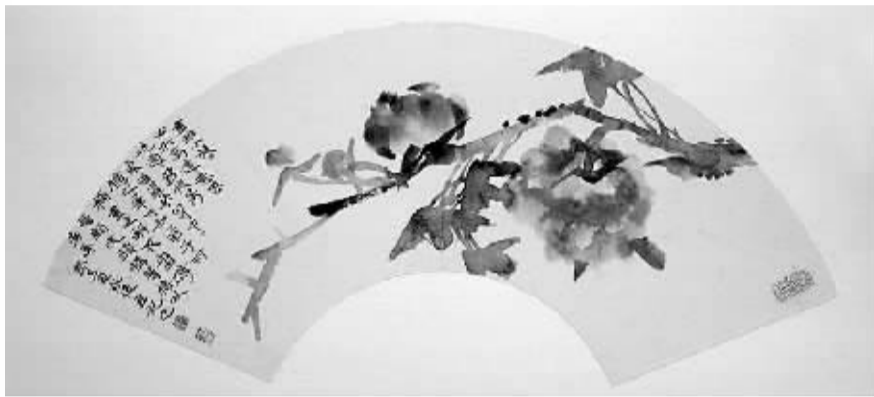
花鸟扇面,宣纸水墨,19×61(厘米),2500元 (中国美术学院国画系学生 夏勇俊)