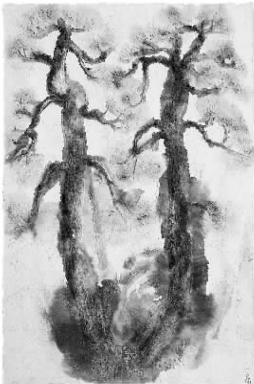
纸雕作品《双松》120×80(厘米),28万元 (中国美术学院教授 邱志杰)