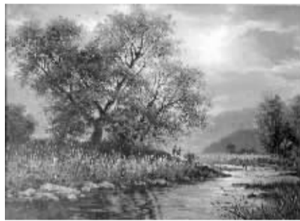
布面油画《乡村的晚霞》90×65(厘米),1.3万元 (朝鲜著名艺术家 金铭吉 万寿台出品)