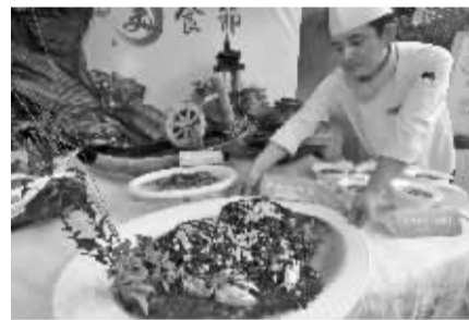
一条重15公斤左右东钱湖鱼做成的“黄 椒酱鱼头”。

商报讯(记者 周雁 通讯员 陈鹏云)昨天下午,第六届中国湖泊休闲节“舌尖上的东钱湖”美食活动开启,东钱湖内的诸多酒店推出了一系列经济实惠的钱湖特色菜。