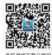
手机游戏下载二维码

合成中心网址: http://www.nbgame.cn/ hecheng/index.php 宁波游戏中心游戏官网: m.nbgame.com.cn 宁波游戏中心微信号: NB88321268