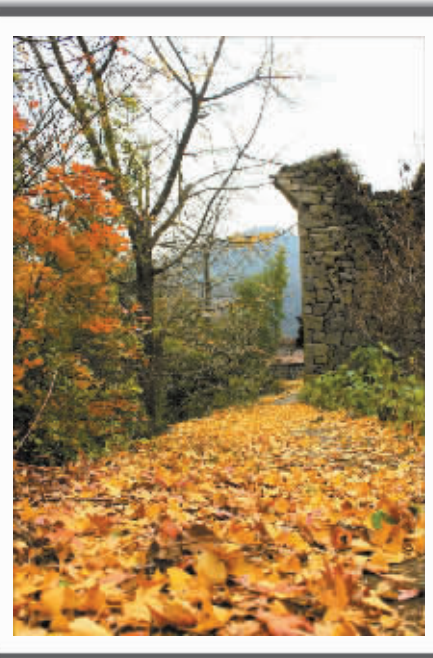
本版所用图片均为资料图

交通指南: 南站柳汀花园坐634路公交车至终点站鄞江镇下车,坐617路往杖锡方向的公交车至茅镬村下。自驾走雅戈尔大道→34省道→鄞江镇→樟村→蜜岩→细岭→茅镬,约60公里。