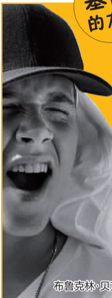
布鲁克林·贝克汉姆

儿子初绽巨星风范,老婆也光芒万丈。“贝嫂”维多利亚·贝克汉姆近日登上英国《今日管理》月刊2014年英国百名最成功企业家榜首。她经营自创时尚品牌,凭借年营业额5年增长约30倍的骄人成绩,成为名副其实的英国“最成功企业家”。哎,这一家人真是令人羡慕嫉妒恨啊!