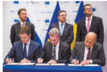
俄乌与欧盟三方代表签署协议。

俄罗斯和乌克兰10月30日就今年冬季天然气输气事宜达成协议,涉及金额达46亿美元。根据协议,乌方将于今年年底前偿还俄方31亿美元债务并支付天然气预付款15亿美元,俄方则保证整个供暖季向乌方输气。