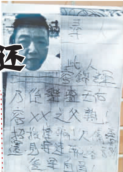
律师:容祖儿不必替父还债