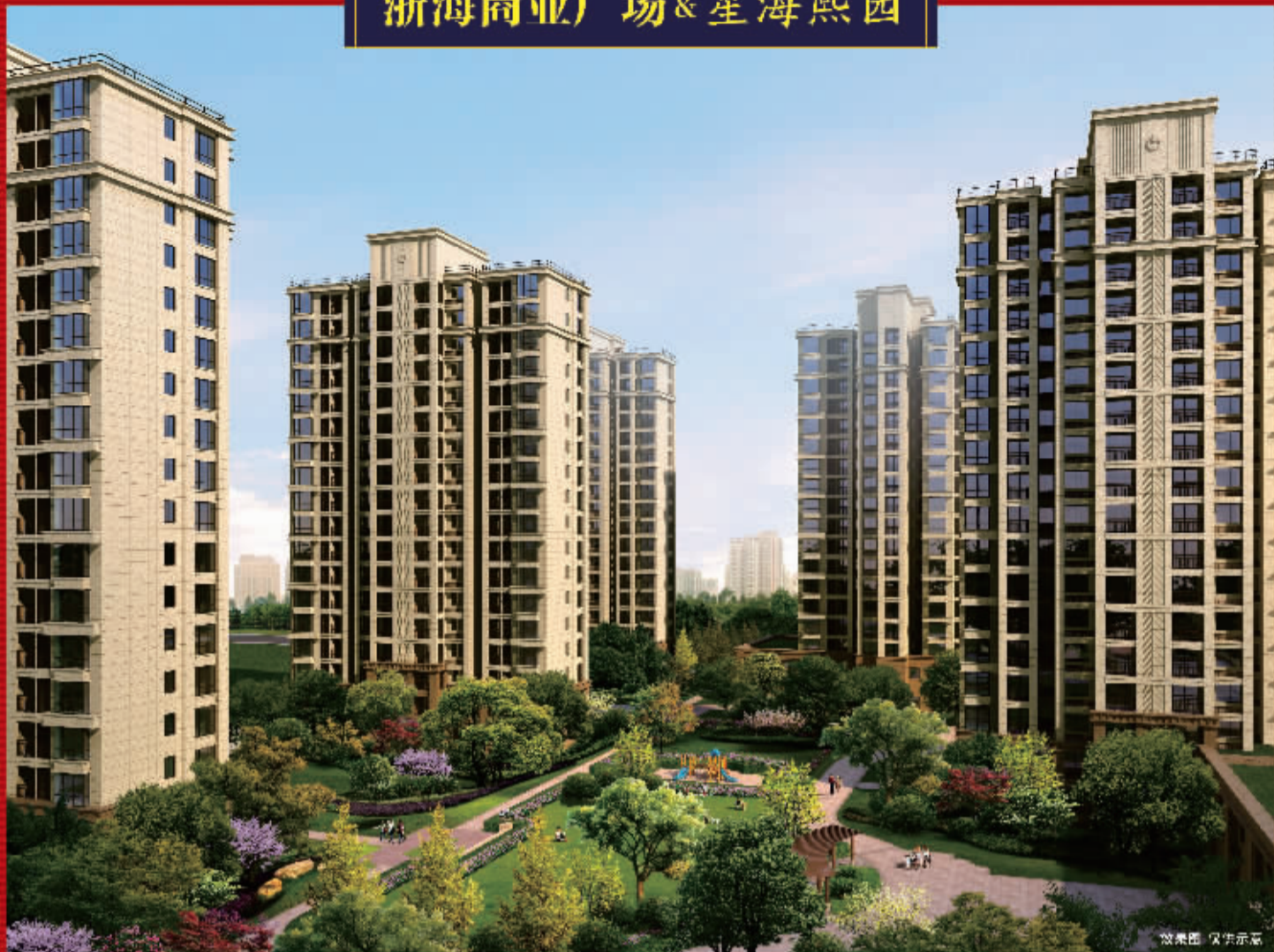
中国美地产之2014年度最佳楼盘