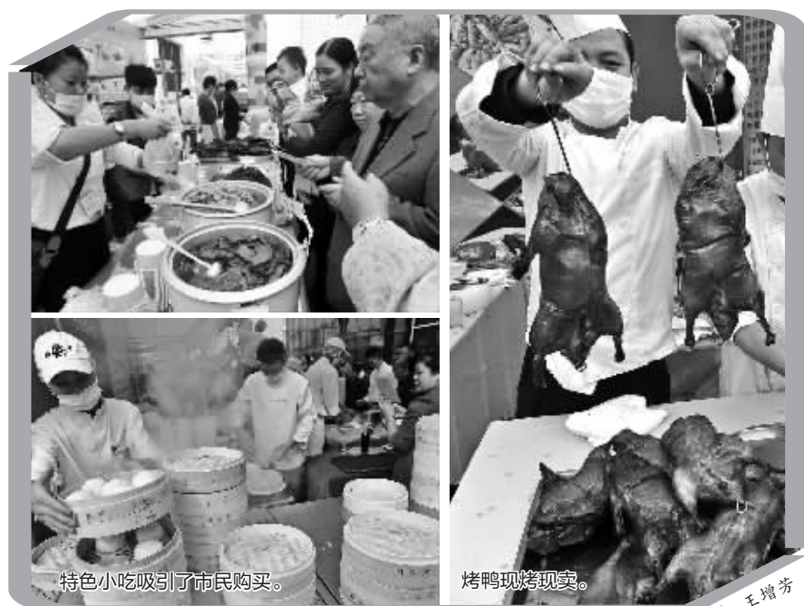
特色小吃吸引了市民购买。

鼎泰丰的小笼包堪称小笼包里的“贵族”。昨天的美食展现场,鼎泰丰的大厨们把原料搬到现场,现包现做小笼包,6元一个,吸引不少市民尝鲜。海鸥宾馆的蟹黄灌