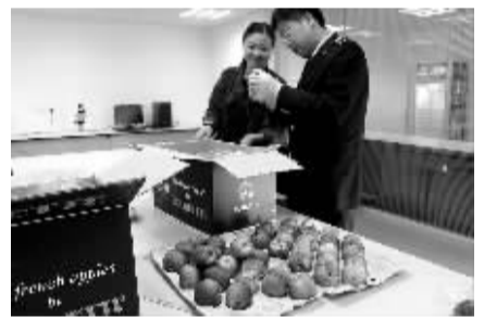
工作人员在开封查验。

此次法国GALA苹果的进口商和国外贸易商共同见证了整个冷链查验过程。在实地看到宁波口岸冷链硬件设施和国检低温查验相结合的新模式后，法国客商当场表示将