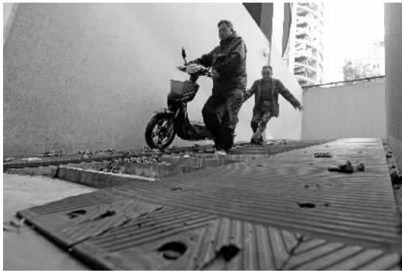
由于坡度比较陡，有居民要下坡停车时，需要有人在后面帮忙控制平衡。