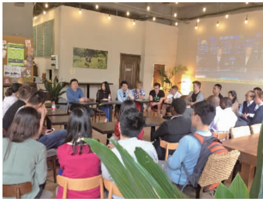
创业咖啡专题活动