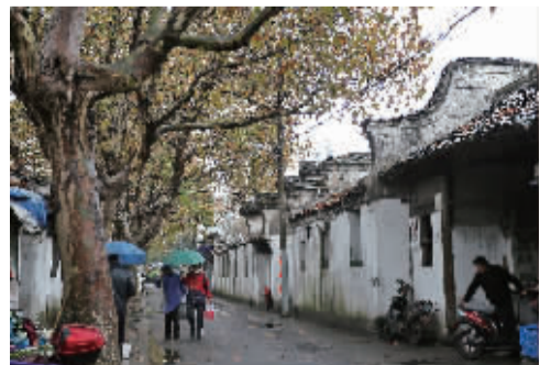
永寿街历史文化街区