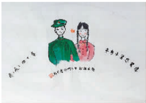
陈柳闻作品《爸妈结婚照》