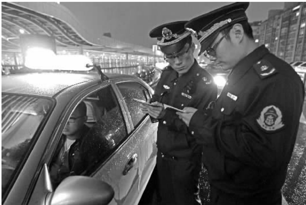
新铁路宁波站,执法人员对出租车进行检查。