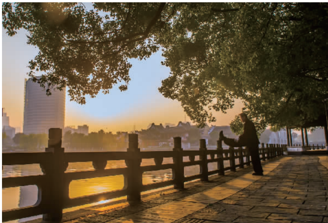
月湖公园里晨练的老者