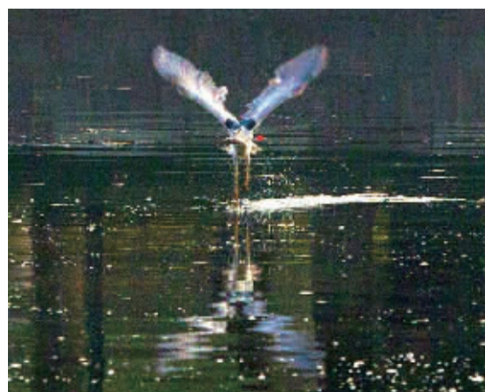
飞鸟掠过湖面,泛起涟漪