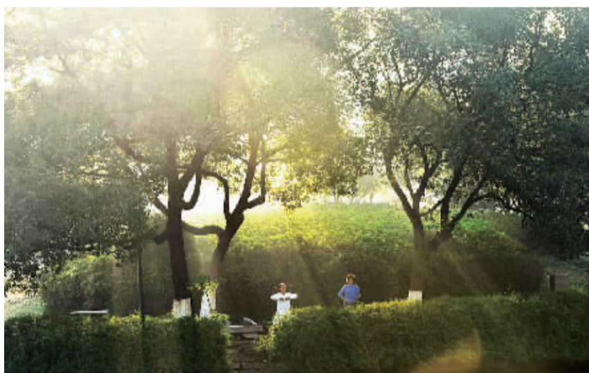
人们或习拳,或散步,为月湖注入生机