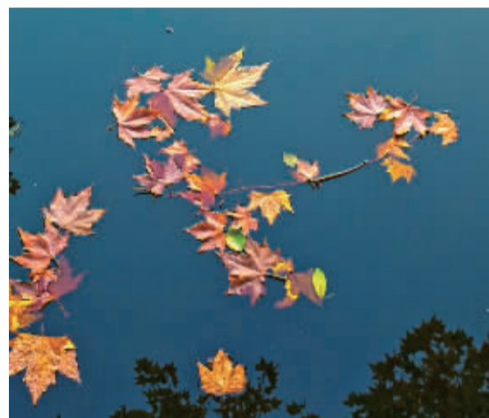
飘落湖面的树叶与湖中倒影相映成趣