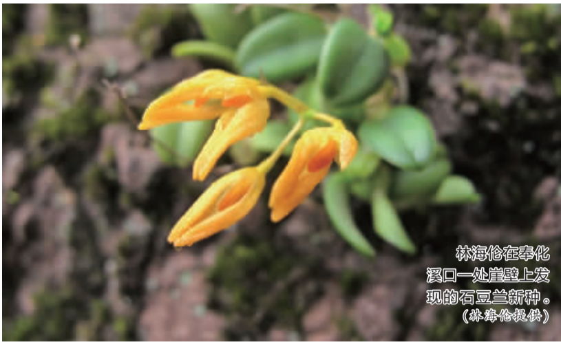
林海伦在奉化溪口一处崖壁上发现的石豆兰新种。