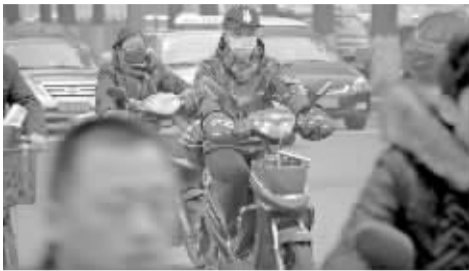
江厦桥西，市民戴起了口罩。

昨天的霾来得有点突然：临近中午，就有那么点“朦胧感”，等到下午，城市的高楼一栋栋“消失”在一片迷雾中。