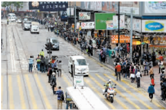
12月15日,香港铜锣湾怡和街恢复通车。