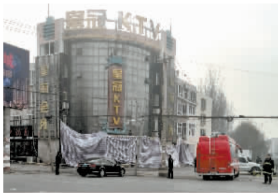
火灾现场已被彩条布遮挡(12月15日摄)。