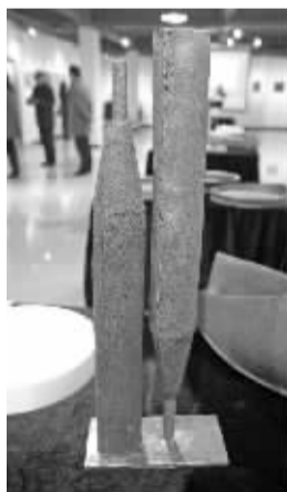
马权《无念之红》，售价7000元