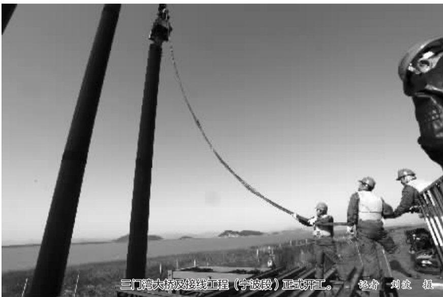
三门湾大桥及接线工程（宁波段）正式开工。

三门湾大桥及接线工程是浙江省规划公路网主骨架“两纵两横十八连三绕三通道”中的“一连”——浙江省沿海高速公路（甬台温高速公路复线）的重要组成部分。