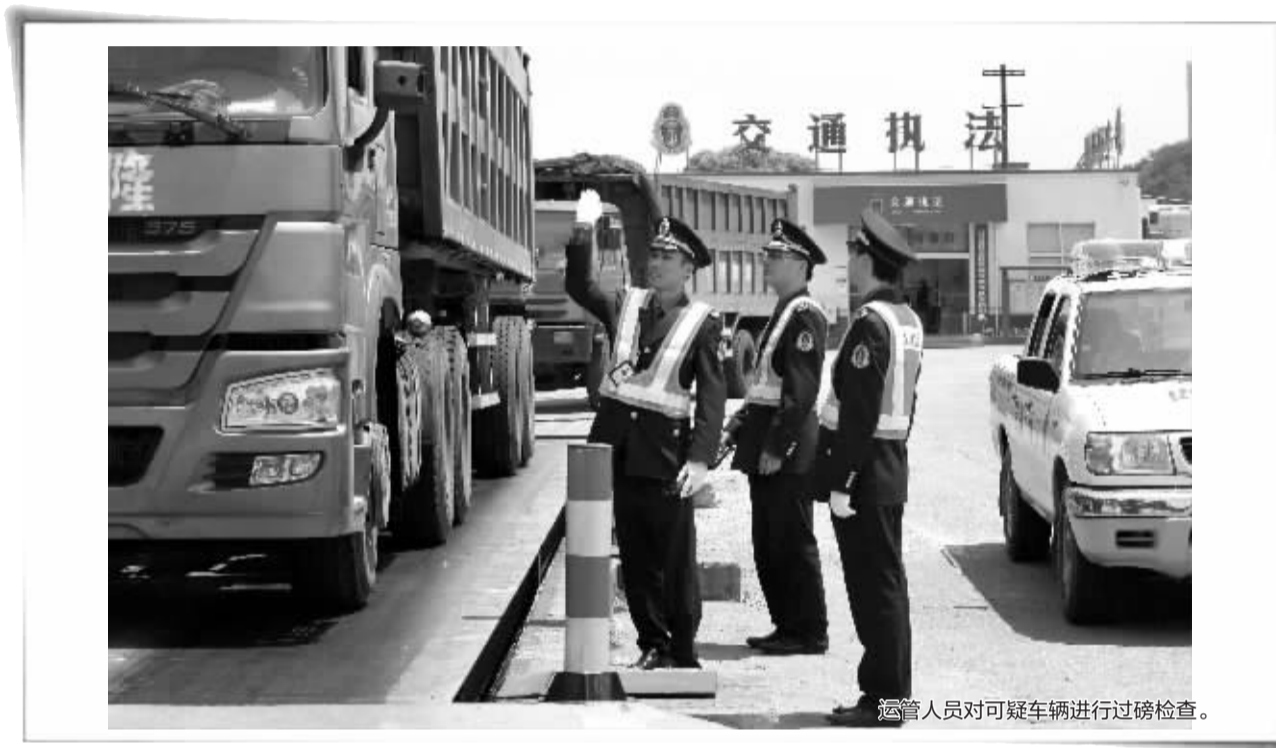
运管人员对可疑车辆进行过磅检查。

从12月15日起,我市运管部门开展了“铁腕4号”行动,在全市范围内集中开展货运、危险品车辆非法改装车辆整治行动。昨天,市运管局相关负责人向记者介绍了行动开展的有关情况。