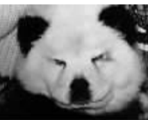
被涂成熊猫的松狮犬。

@BigW： [据报道，意大利一个马戏团的两只狗被警方没收，理由是它们被涂成黑白两色冒充熊猫。这两只狗其实是松狮，被马戏团装扮成熊猫骗观众付费合影，有不少小孩子上当。马戏团方面则否认欺骗观众，称“这一看就是狗啊”。] 好歹把眼圈涂黑好吗？活儿太糙了！