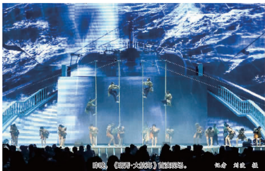
昨晚,《明秀·大航海》首演现场。