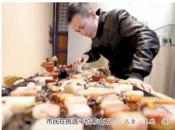
市民在挑选平价寿山石。