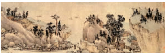
沈周《吴山东庄图卷》

这次《见大草堂藏古代书画展》的亮点，是从宋代到元明的一批书画精品，其中囊括了明四家（沈周、文徵明、唐寅、仇英）的代表性作品。黄柏林介绍道：“比如文徵明的《衡翁三绝手卷》、唐寅的《东坡探梅图轴》、钱仁夫的《虞山献秀图卷》，这些都是明中期非常好的书画作品，在取法传统笔墨的基础上进行了大胆创新，并且将个人精神和审美趣味，融合到笔墨当中。”