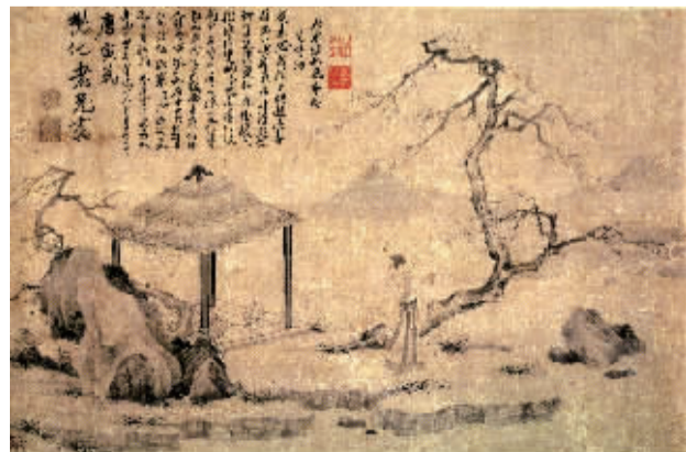
唐寅《东坡探梅图轴》