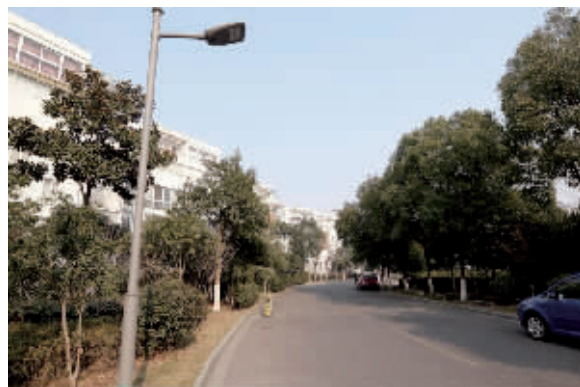
天一家园新装的路灯。

“照亮百姓回家路”专项行动是城管市政部门发起的一项民生工程，旨在对老小区的路灯进行LED更新改造，以达到照明高效、节能、环保的目的。让老小区的照明环境在新年来临之前，焕发出新的风貌。