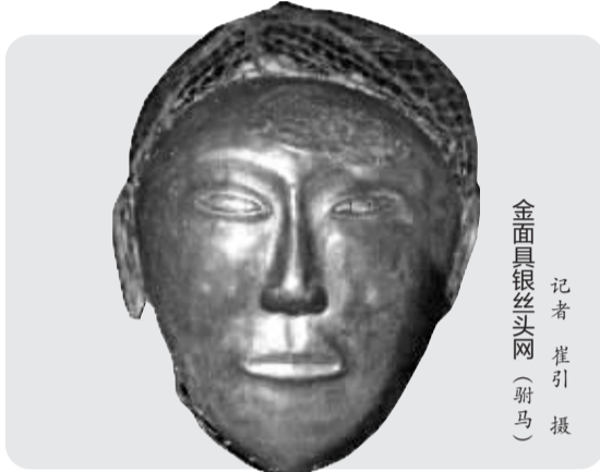
金面具银丝网(驸马)