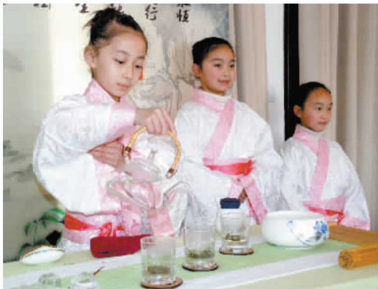
古色古香的茶室中，学生们有模有样地完成了一整套的茶艺表演。