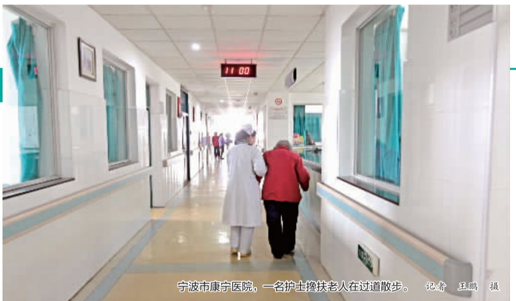
宁波市康宁医院，一名护士搀扶老人在过道散步。