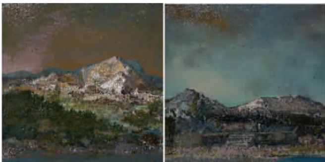
境象 - 行旅