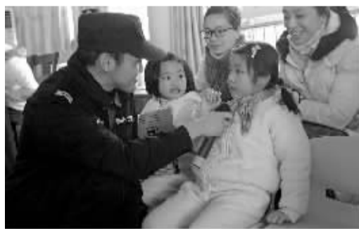
警察叔叔给小朋友讲安全故事。