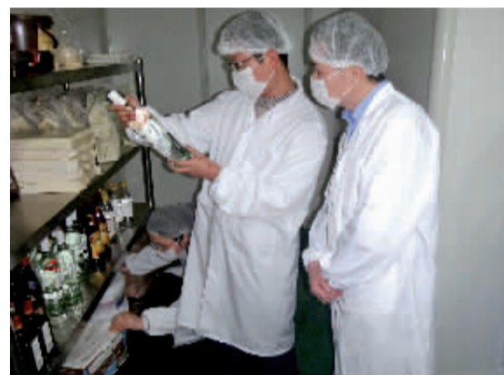
在食品企业检查使用的原材料