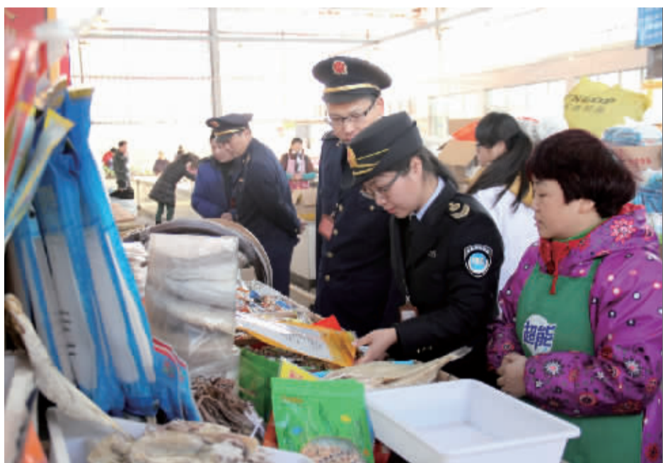
检查农贸市场食品