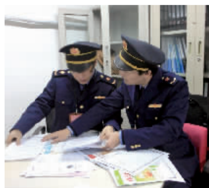
在一医药企业检查相关购销凭证