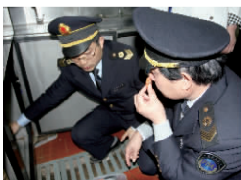
酒店厨房检查食材