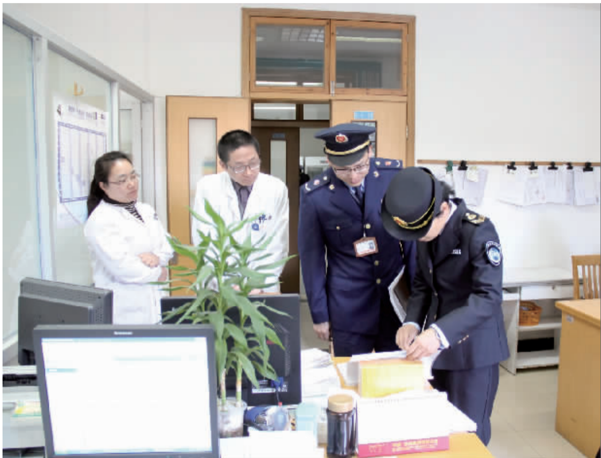
在医疗机构检查特殊药品的使用记录