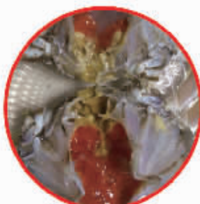
红膏炆蟹