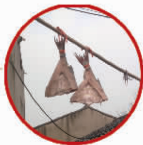
胖头鱼鲞——AA 轩妈潮鞋批发 *_(☆_☆) 提供

由“吃遍宁波”微信公众号联合《东南商报》于2015年1月22日推出的“2015年你心目中的年货”征集活动中奖名单公布如下：