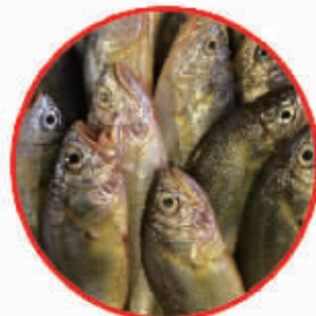
小黄鱼——聆听者提供