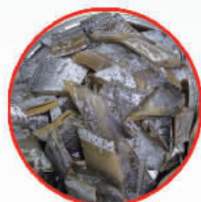
带鱼鲞——宝哥 爱糖葫芦提供

鸣谢“吃遍宁波”微信公众号的大力支持！以及陆龙、绿姿、大梁山对本次活动的奖品赞助！