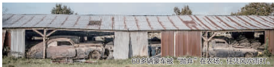
60多辆豪车被“抛弃”在农场，任凭风吹雨打。

“绝大多数案例中，我们发现一个人的行为变得极端化了，但其家人或朋友选择不干预，”他说，“没有外界的干预，事情总会以最熟悉的方式结束，那就是死亡。” 据新华社