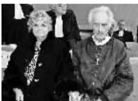
盖内克夫妇出庭作证。