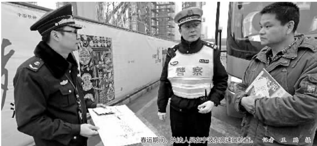
春运期间,执法人员在宁波东高速口检查。

又是一年春运时。近年来,受到高铁开通,及私家车出行的影响,春运道路运输的客流一直在降,据预测,2015年春运40天全市将发送旅客562万人次,为去年同期的91%;周转量4.9亿人公里,为去年同期的90%。