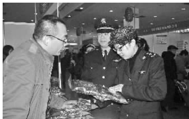
江东区市场监管局在年货展销会现场检查。