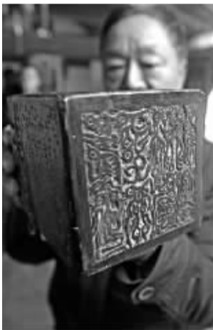
玉玺（仿品）底部的虫鸟篆文