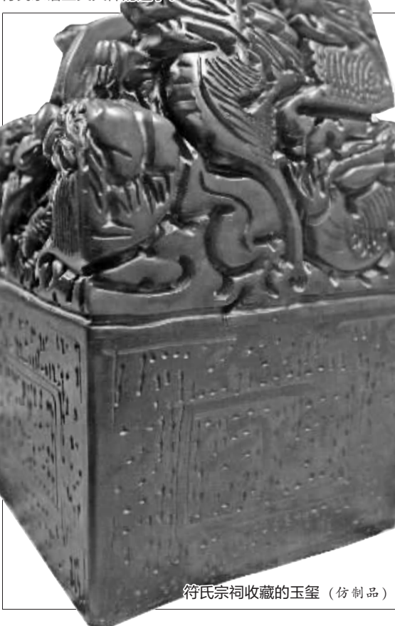
符氏宗祠收藏的玉玺（仿制品）