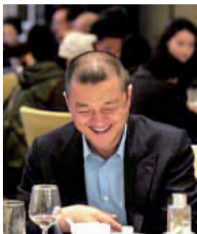
网友曝李亚鹏近照, 头发已不“富裕”了。