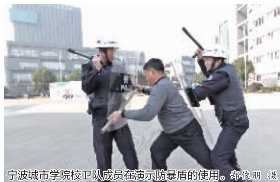
宁波城市学院校卫队成员在演示防暴盾的使用。

（含幼儿园）要建设校园警务联络室，乡镇、农村、流动人口子女学校可以根据实际情况建设校园警务联络室。