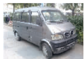
十天前的无牌面包车仍在路口