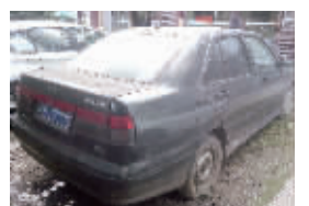
有牌的私家车也还在原地